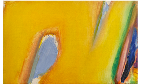
Olivier Debré, Tout jaune tache bleue , œuvre présentée à l'exposition, huile sur toile monogrammée, 23x36cm, 1992

Dans le contexte actuel, le vernissage de l'exposition le 10 avril est prévu sous un format réduit afin de respecter la distanciation sociale en vigueur. L'artiste sera présent durant deux jours de la semaine suivante (13 et 14 avril, de 11h à 19h), afin de permettre à ceux qui le souhaitent de visiter l'exposition et de rencontrer l'artiste dans un contexte de moindre influence. Masques et gel seront fournis à l'entrée, merci d'en faire usage.