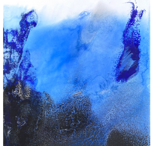
Silvère Jarrosson, Signe paysage , œuvre présentée à l'exposition, technique mixte sur toile, 30x24cm, 2021