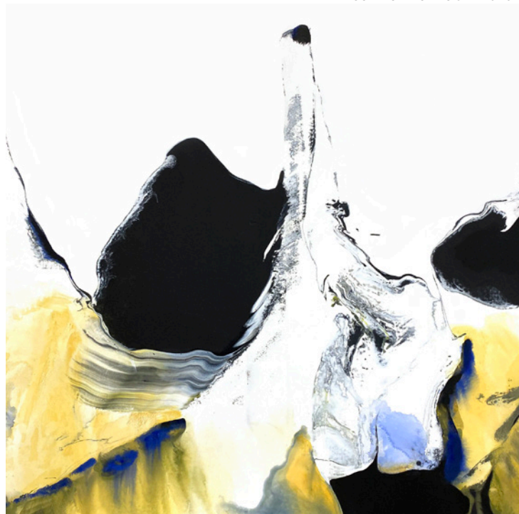
SILVÈRE JARROSSON, Hommage à Olivier Debré , technique mixte sur toile, 81x54 cm, 2020