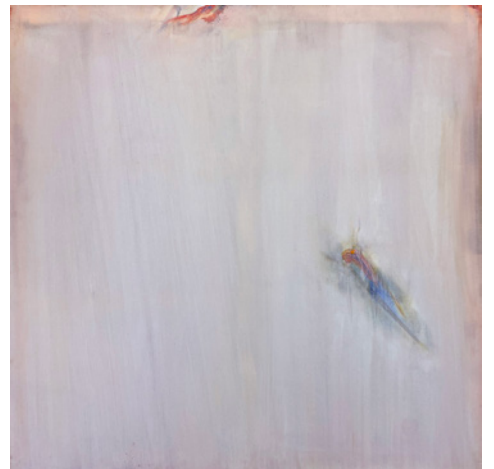
Olivier Debré, Blanche rose Touraine , œuvre présentée à l'exposition, huile sur toile monogrammée, 150x150 cm, 1982-83