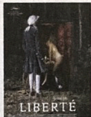
● Liberté / Albert Serra (Blaq Out, 2020)

Dans un décor merveilleux qui tient de la projection mentale, des libertins lâchent la bride de leur imagination sexuelle. Directement inspiré par Sade, le cinéaste saisit dans ce film (interdit au moins de 16 ans) l'accablement des corps lorsqu'ils prennent conscience de l'illimitation du désir. C'est finalement ainsi que nous éprouvons notre liberté: en jouant avec la contrainte et la frustration.