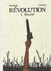
● Révolution / Florent Grouazel et Younn Locard (Actes Sud, 2019)

Ses grandes toiles abstraites évoquent des paysages minéraux. Silvère Jarrosson les peint comme il danse, dans un mouvement chorégraphique qui donne forme à de grandes masses de pigments. Passé par l'Opéra de Paris, ayant dû renoncer à la danse après s'être blessé, l'artiste rappelle que la liberté consiste d'abord dans le jeu avec la contingence et les limites, celles de la matière et du monde.