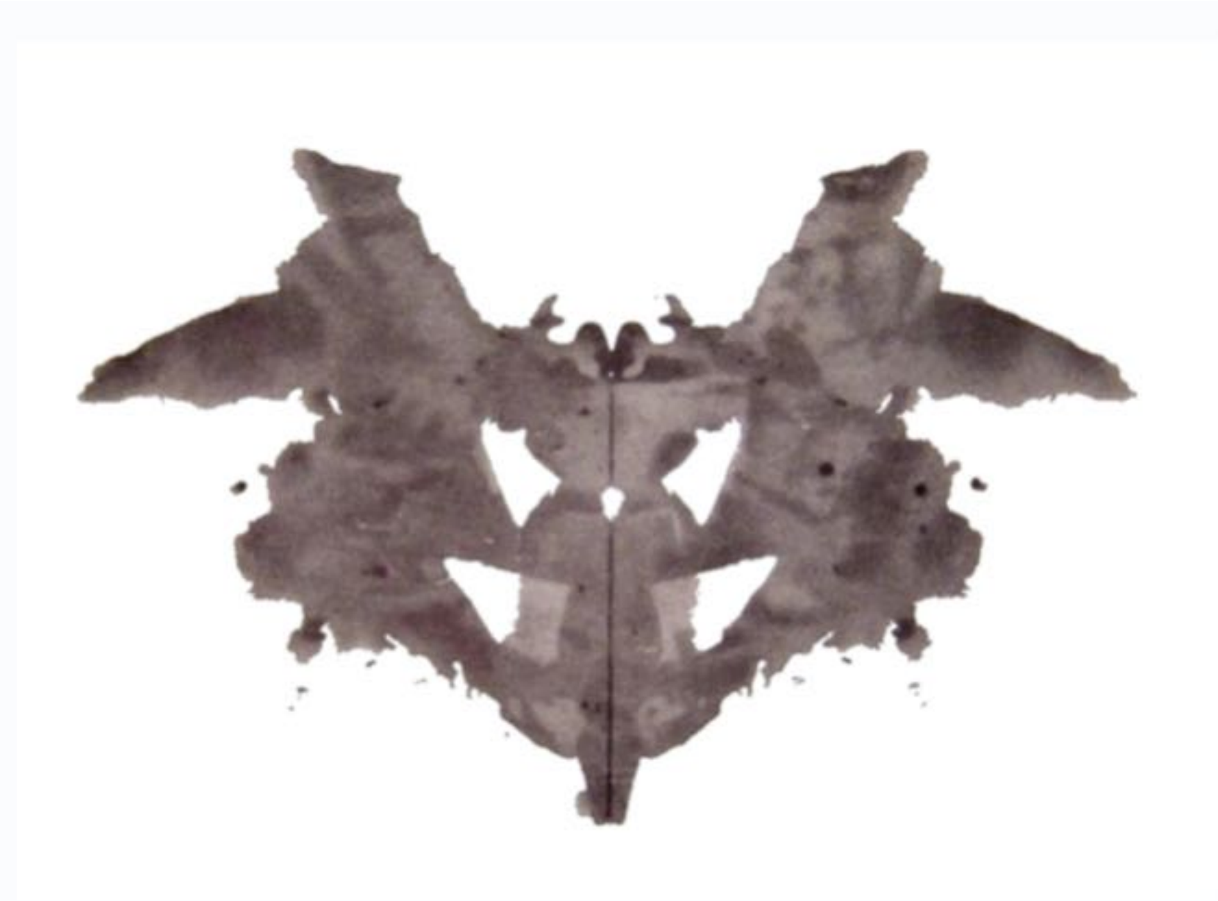
Tache de Rorschach (1921)

Si les taches d'encre utilisées par Hermann Rorschach à partir de 1921 (dans le célèbre test psychanalytique du même nom) stimulent notre imagination, ce n'est pas tant parce qu'elles ressemblent toujours vaguement à des choses connues que parce qu'elles ne ressemblent exactement à aucune d'elles. L'intérêt du test est alors de savoir ce que le patient va raconter sur cette partie non reconnaissable des taches, le récit qu'il va former à partir de ce qui est hors du monde connu.